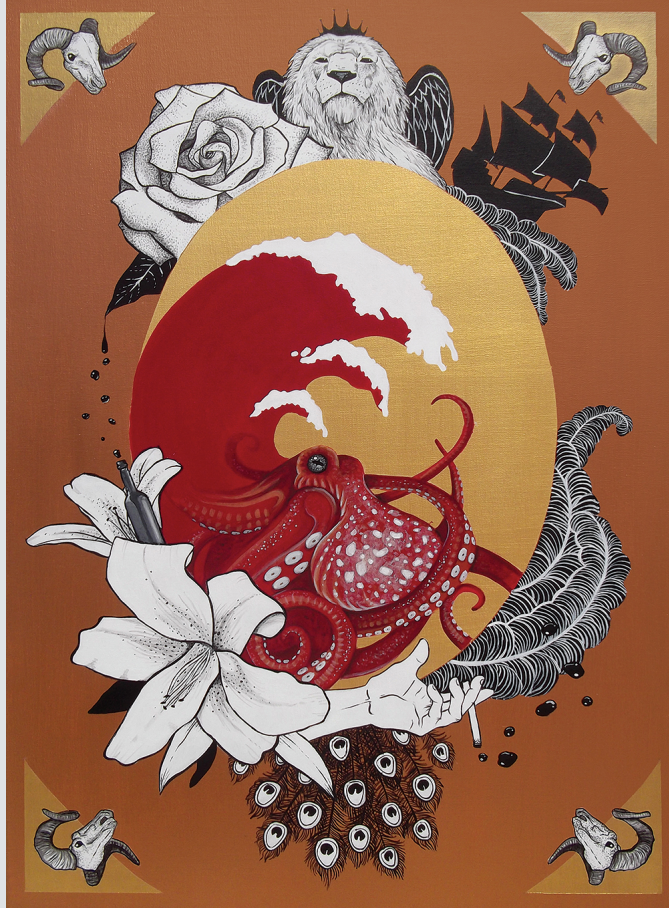
Αιματοκύμα | Σταμάτης Θεοχάρης | Ακρυλικό σε καμβά, 70 x 50 εκ., 2016