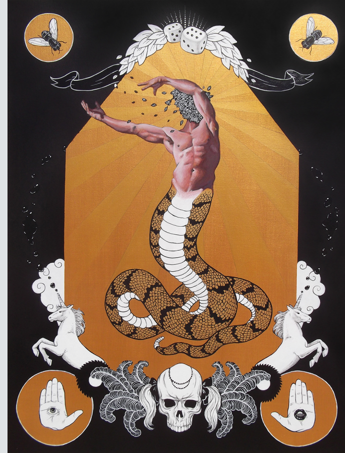
Βασιλόφιβο | Σταμάτης Θεοχάρης | Ακρυλικό σε καμβά, 80 x 60 εκ., 2016